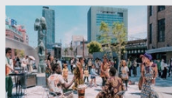
官民協調によるエリアマネジメント （兵庫県神戸市 サンキタ広場）

【出所】「都市の個性の確立と質や価値の向上に関する懇談会」中間取りまとめ概要資料より作成