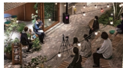
民有地を活用した「路地の公園化」 （Slit Park YURAKUCHO）