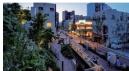
官民連携によるアーバンデザインの策定 （群馬県前橋市馬場川通り）