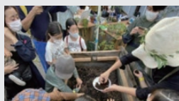
有志コミュニティによる パブリックライフ（シモキタ園芸部）