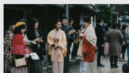
歴史的資源を活用したシビックプライドの 醸成（愛媛県大洲市）