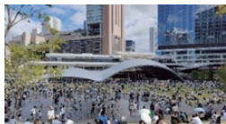
「みどり」と融合した生命力あふれる 都市空間（グラングリーン大阪）

③まちを「育てていく」という視点により、 将来の可変性・柔軟性を許容する 「余白」の創出を促進