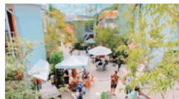
まちと人の関係を「発酵」させる 支援型開発（下北線路街）